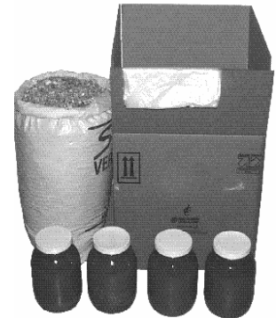
Illustration n° 1.

La RESPONSABILITÉ DE L'EXPÉDITEUR consiste à s'assurer que les récipients internes, les bouchons, les sacs étanches, les matériaux de rembourrage ou absorbants (si pertinent) sont compatibles avec le contenu et, pour le transport aérien, que les récipients internes pour les liquides peuvent supporter une pression interne différentielle minimale de 95 kPa sans fuites. Certains liquides volatiles peuvent exiger une épreuve de pression supérieure. Consultez les Instructions techniques de l'OACI Partie 4, Chapitre 1, Paragraphe 1.1.6 ou la Réglementation pour le transport des marchandises dangereuses de l'IATA Partie 5.0.2.9.